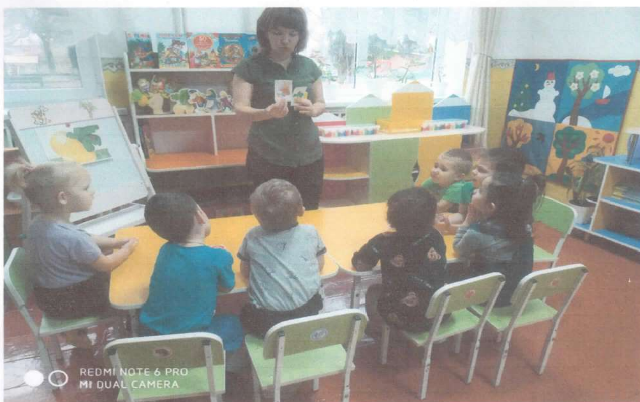
Дидактическая игра: «Правильно или нет!»