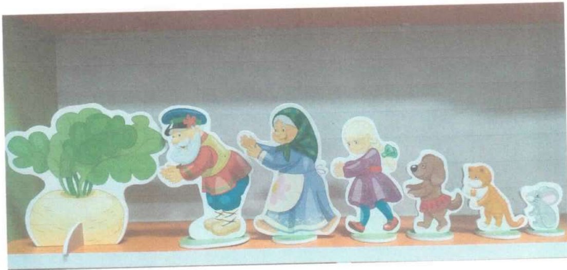
Предметные фигурки героев сказки «Репка»