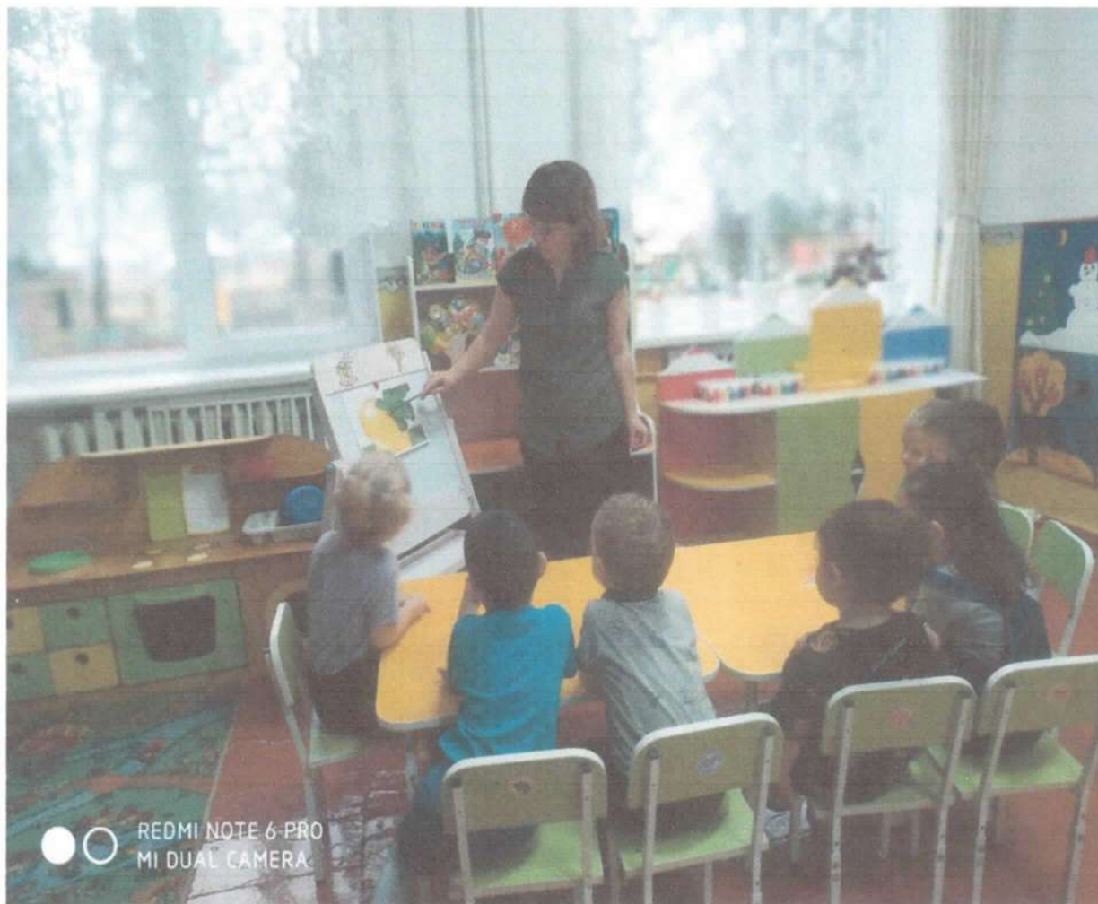
Дети рассматривают иллюстрацию «Репка»

к (ООД) по речевому развитию детей группы раннего возраста на тему: «Сказка «Репка»»