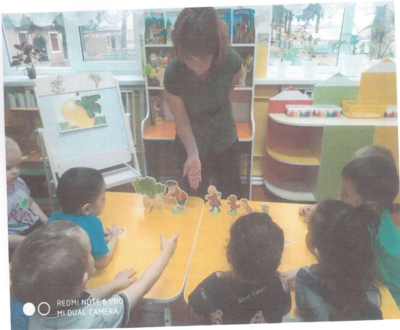
Дидактическая игра: «Кого не хватает?»