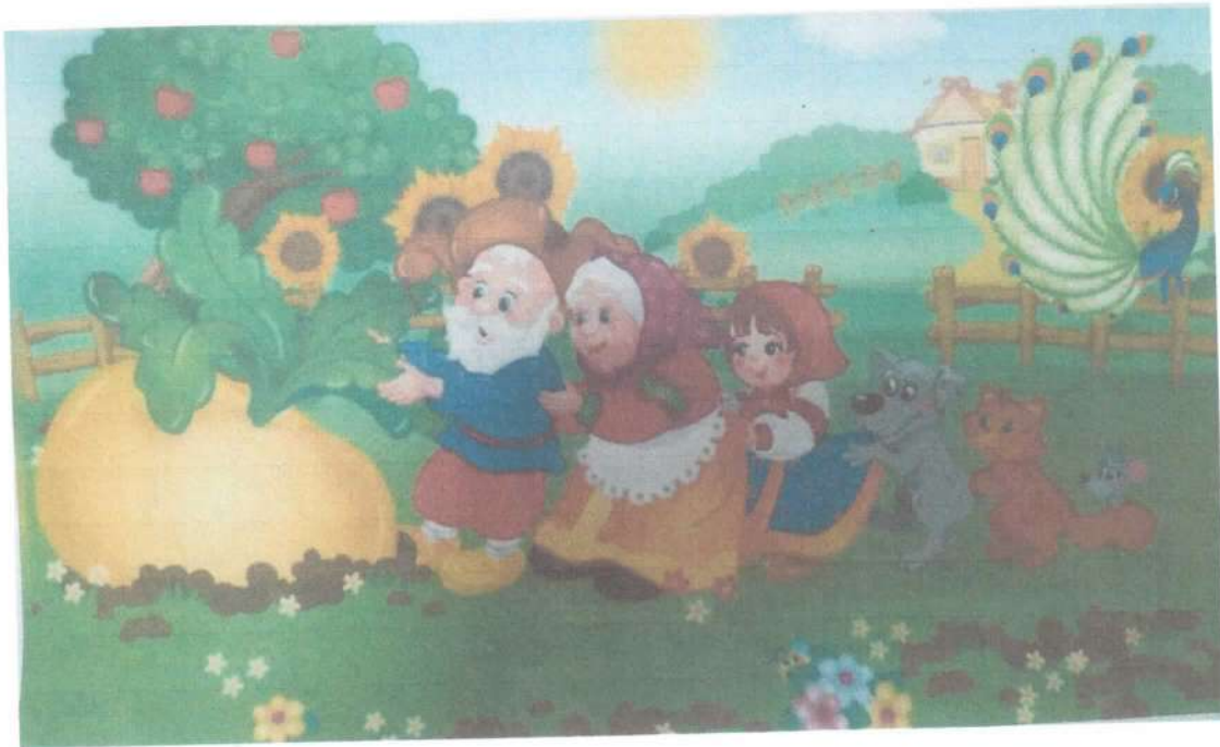
Сюжетная картинка героев сказки «Репка».