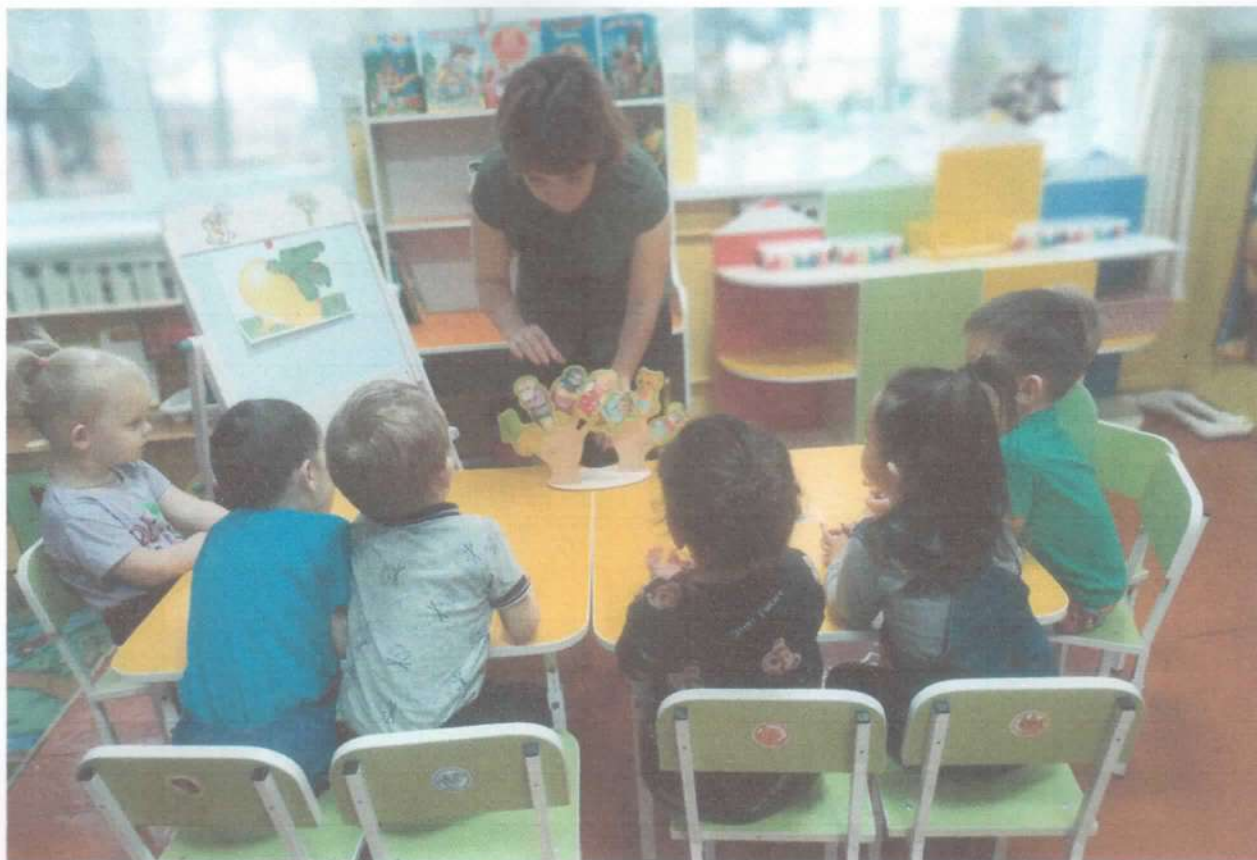
Дети рассматривают фигурки героев сказки.