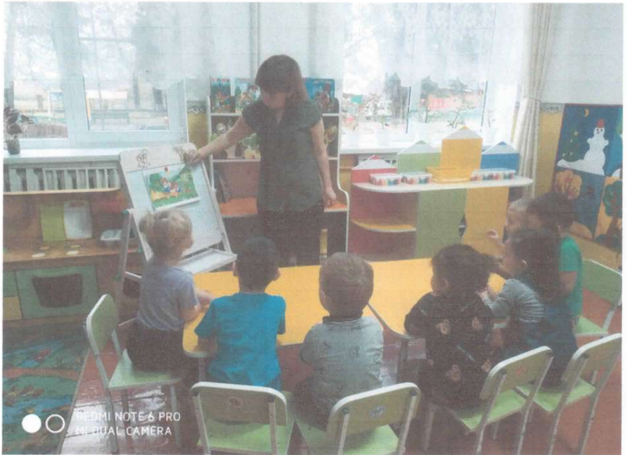
Дети рассматривают иллюстрацию с героями сказки «Репка»