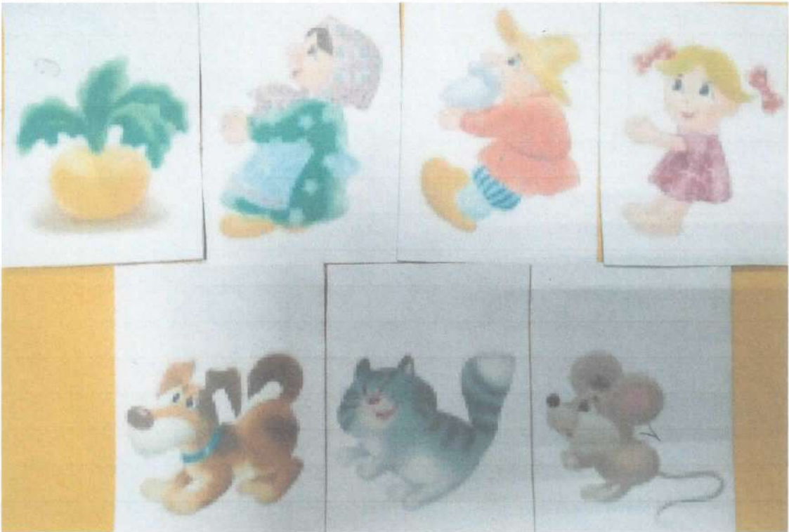
Предметные картинки героев сказки «Репка».